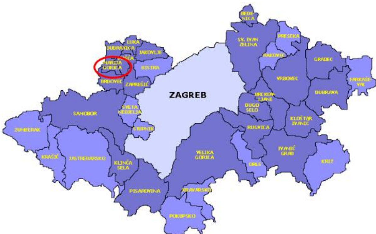
Slika 1: Položaj Općine Marija Gorica u Zagrebačkoj županiji

Područje općine prostire se na površini od 17,10 km 2 odnosno na 0,56% ukupne površine županije koja iznosi 3.058,15 km 2 . Prema površini Općina Marija Gorica je najmanja u Zagrebačkoj županiji.