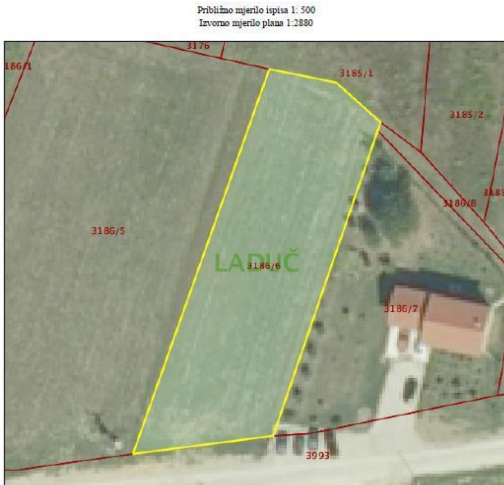
Slika 3: Izvod iz katastarskog plana – lokacija reciklažnog dvorišta

Dvori, ulica Bana Josipa Jelačića 168, Zaprešić, na k.č. 117/5, k.o. Zaprešić. Reciklažno dvorište upisano je u očevidnik reciklažnih dvorišta pod oznakom REC-122-G-2, a kao upravitelj je upisano trgovačko društvo Zaprešić d.o.o.