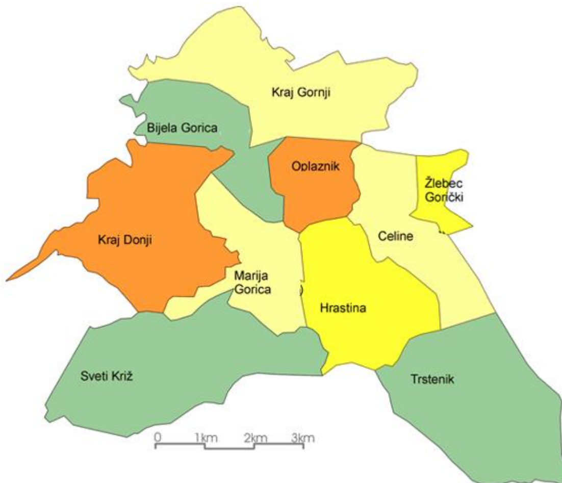
Slika 2: Naselja Općine Marija Gorica

Općina Marija Gorica obuhvaća 10 naselja: Bijela Gorica, Celine Goričke, Hrastina, Kraj Donji, Kraj Gornji, Marija Gorica, Oplaznik, Sveti Križ, Trstenik i Žlebec Gorički. Središnje naselje općine je naselje Marija Gorica.