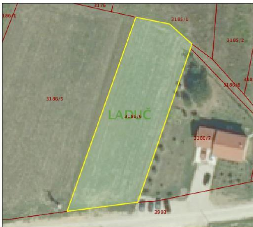
Slika 3: Izvod iz katastarskog plana – lokacija reciklažnog dvorišta

Približno mjerilo ispisa 1: 500 Izvorno mjerilo plana 1:2880