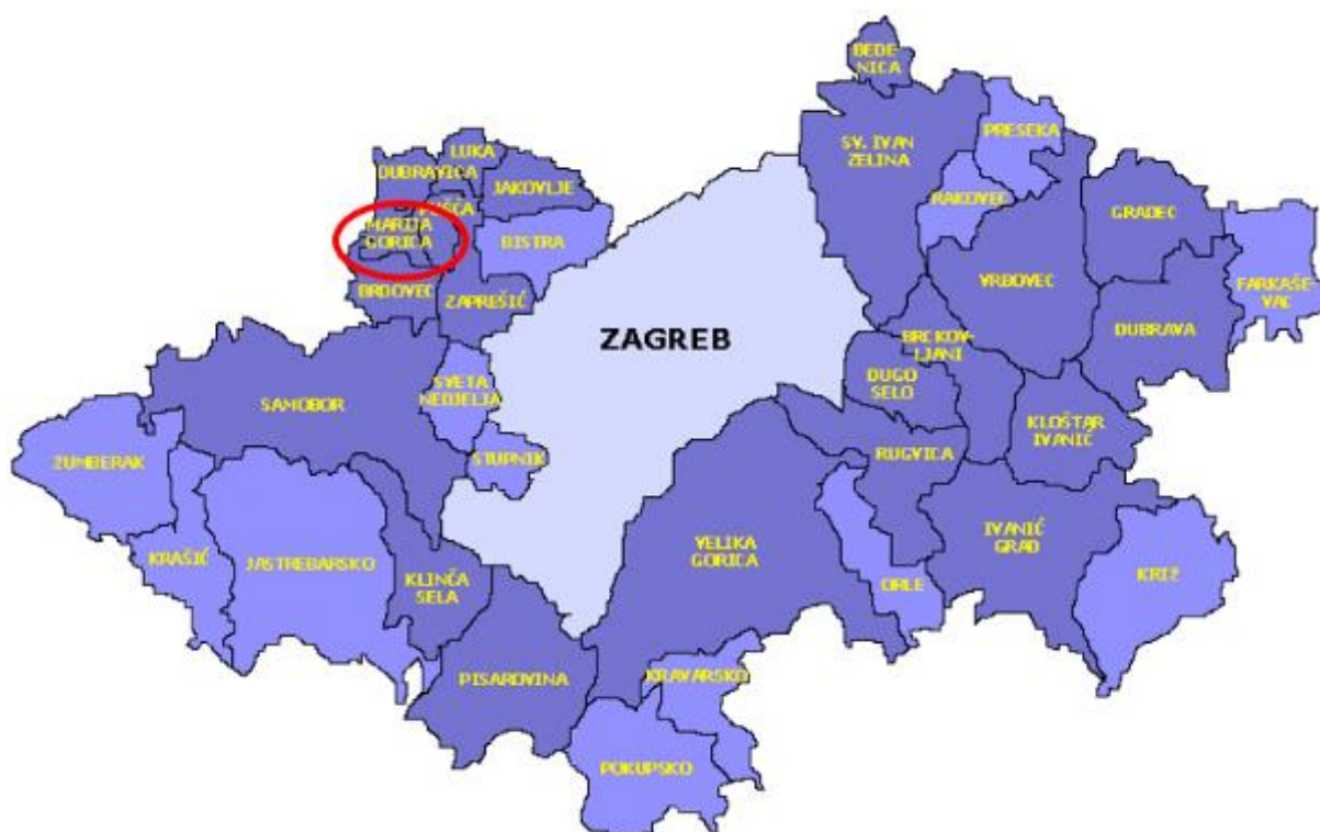
Slika 1: Položaj Općine Marija Gorica u Zagrebačkoj županiji

Područje općine prostire se na površini od 17,10 km 2 odnosno na 0,56% ukupne površine županije koja iznosi 3.058,15 km 2 . Prema površini Općina Marija Gorica je najmanja u Zagrebačkoj županiji.