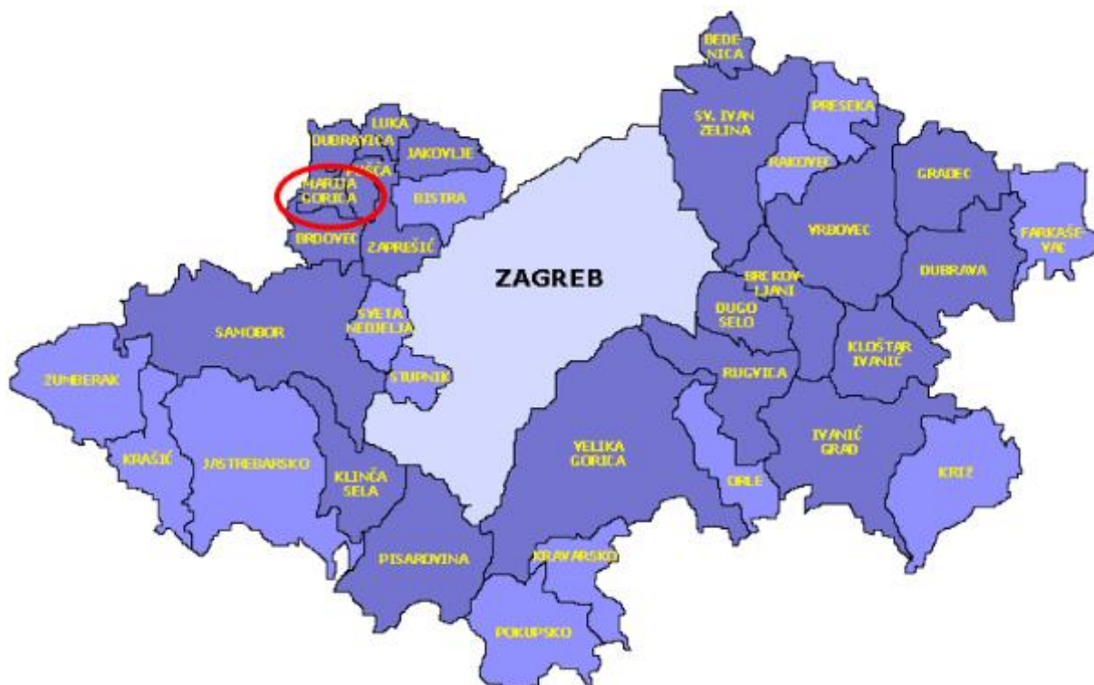
Slika 1: Položaj Općine Marija Gorica u Zagrebačkoj županiji

Područje općine prostire se na površini od 17,10 km 2 odnosno na 0,56% ukupne površine županije koja iznosi 3.058,15 km 2 . Prema površini Općina Marija Gorica je najmanja u Zagrebačkoj županiji.